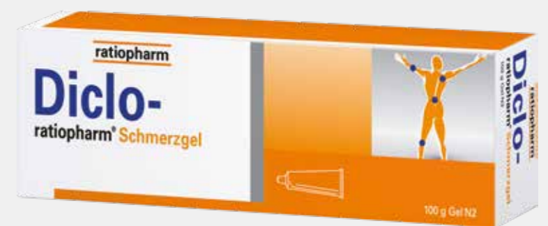
Diclo-ratiopharm Schmerzgel* 100 g

* Zu Risiken und Nebenwirkungen lesen Sie die Packungsbeilage und fragen Sie Ihren Arzt oder Apotheker. Verkauf solange der Vorrat reicht. Irrtümer und Änderungen vorbehalten. Abbildungen können von den Originalprodukten abweichen. ** Die durchgestrichenen Preise sind die Apothekenverkaufspreise (AVP) bzw. die unverbindliche Preisempfehlung (UVP) gemäß sog. Lauer-Taxe. Sie sind der niedrigste Verkaufspreis der letzten 30 Tage vor Aktionsstart. Die prozentuale Ersparnis bezieht sich auf diesen Preis. Bei Schmerzen oder Fieber ohne ärztlichen Rat nicht länger anwenden als in der Packungsbeilage vorgegeben! Die Aktionspreise sind gültig bis zum 31.12.2022. Stand September 2022. Für Druckfehler keine Haftung.