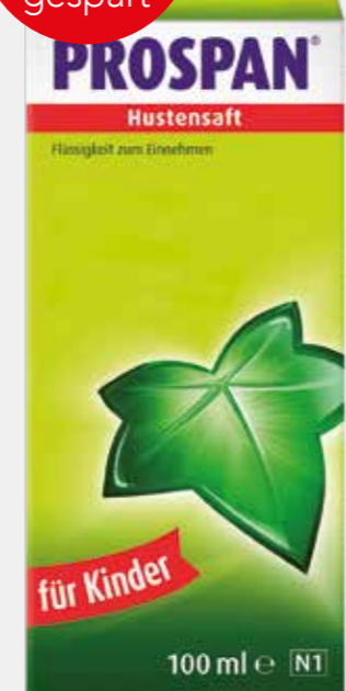
PROSPAN Hustensaft* 100 ml