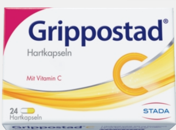
Grippostad C*1 24 Hartkapseln