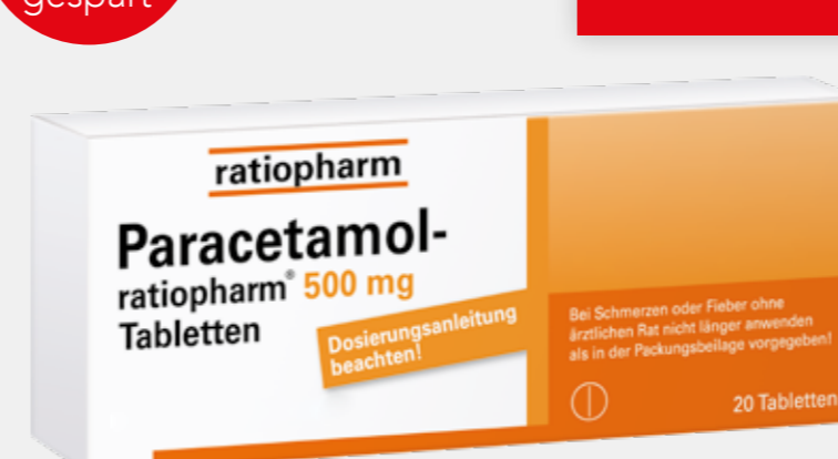
Paracetamol-ratiopharm 500 mg*1 20 Tabletten