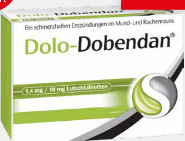
Dolo-Dobendan* 36 Lutschtabletten