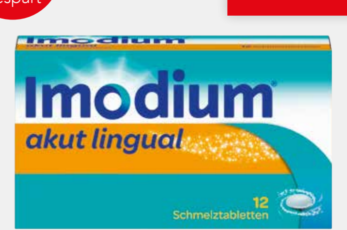
Imodium akut lingual* 12 Schmelztabletten