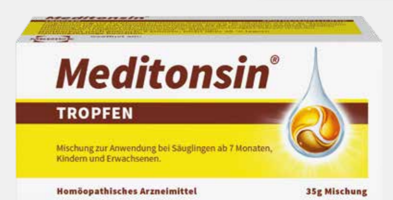
Meditonsin TROPFEN* 35 g