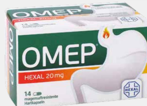
OMEP HEXAL 20 mg* 14 magensaftresistente Hartkapseln