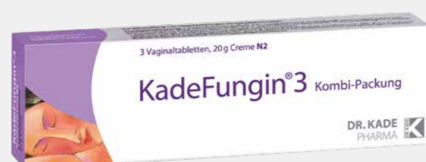
KadeFungin 3* 1 Kombi-Packung