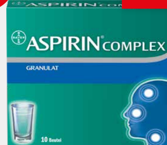
ASPIRIN COMPLEX*1 10 Beutel